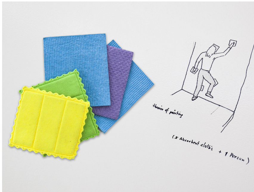
Metrum, 2015 Earth measure, 2015 Theory of Painting, 2014