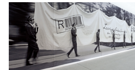
Goshka Macuga, The letter

Realizzate una performance e documentatela