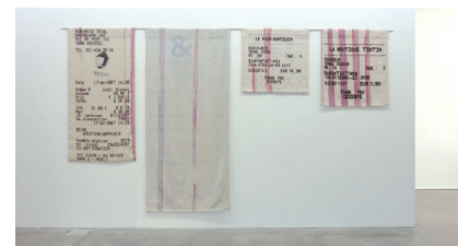
Gabriel Kuri, Untitled (Magenta Stripe Gobelín)

Realizzate un'installazione a partire da un tema e da oggetti quotidiani