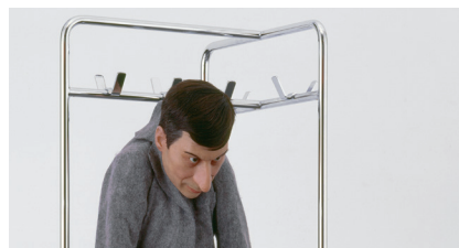
Maurizio Cattelan, La rivoluzione siamo noi

Scegliete un'opera d'arte e create la vostra versione