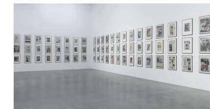
Hans-Peter Feldmann, 9/12 Front Page

Realizzate un progetto utilizzando immagini già esistenti