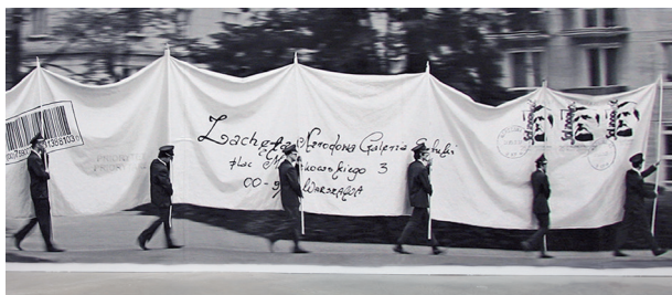
Goshka Macuga, The letter , 2011