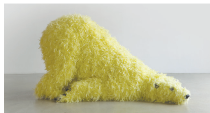
Paola Pivi, Have You Seen Me Before?

Create una collezione di animali fantastici