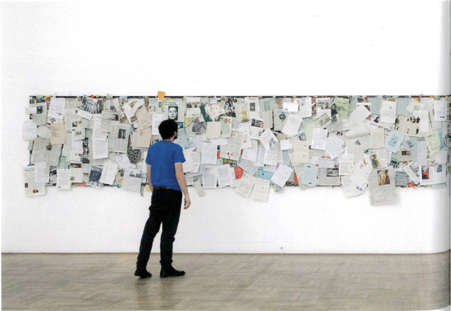
Notice Board, 2011